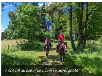
A cheval au coeur de l'Écosse auvergnate