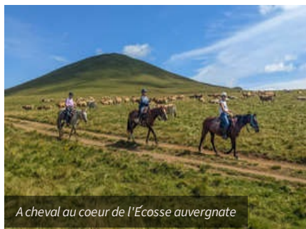
A cheval au coeur de l'Écosse auvergnate