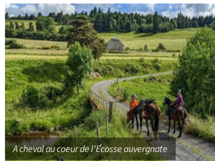
A cheval au coeur de l'Écosse auvergnate