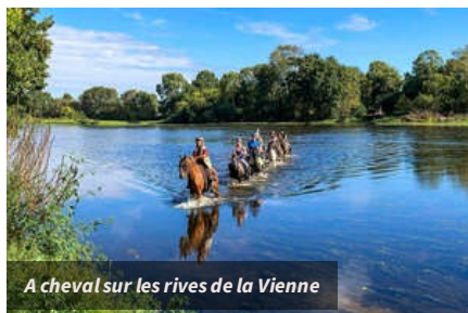
A cheval sur les rives de la Vienne