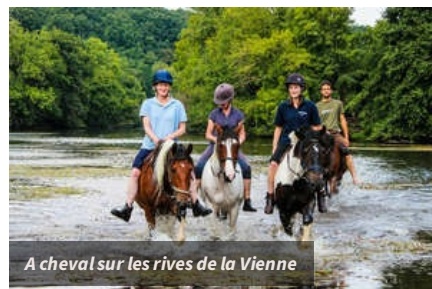
A cheval sur les rives de la Vienne