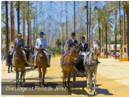
Dressage et Feria de Jerez