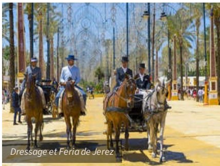
Dressage et Feria de Jerez