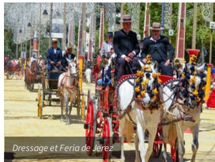
Dressage et Feria de Jerez