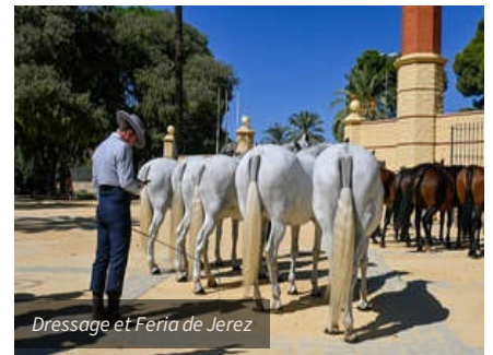
Dressage et Feria de Jerez