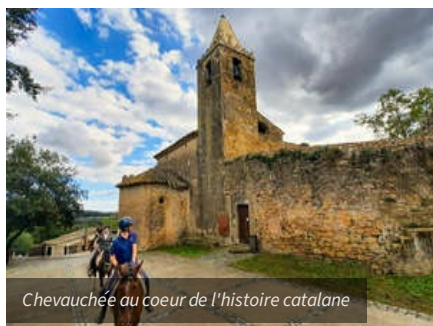
Chevauchée au coeur de l'histoire catalane