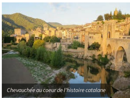
Chevauchée au coeur de l'histoire catalane