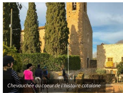
Chevauchée au coeur de l'histoire catalane