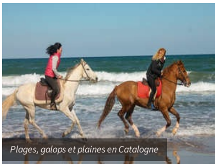
Plages, galops et plaines en Catalogne