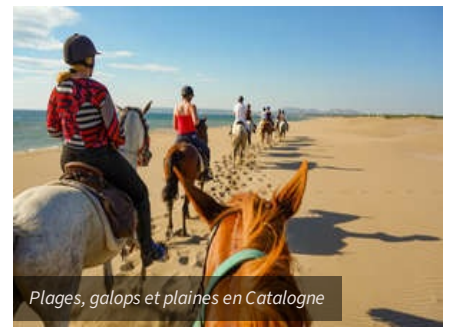
Plages, galops et plaines en Catalogne