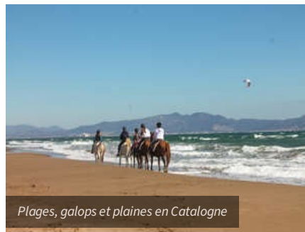
Plages, galops et plaines en Catalogne