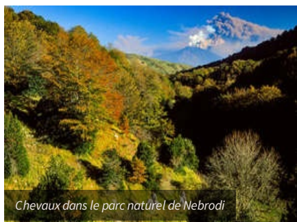
Chevaux dans le parc naturel de Nebrodi