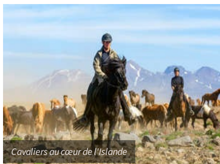
Cavaliers au cœur de l'Islande