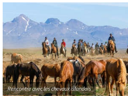
Rencontre avec les chevaux islandais