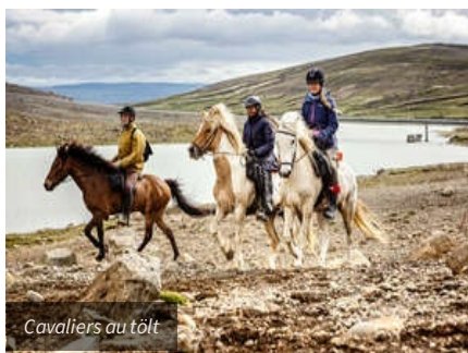
Cavaliers au tölt