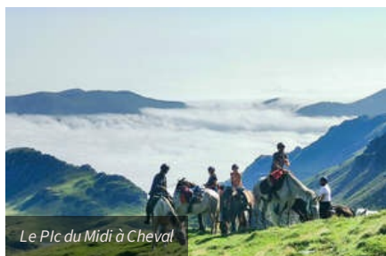
Le Pic du Midi à Cheval