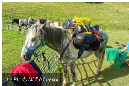
Le Pic du Midi à Cheval