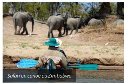
Safari en canoë au Zimbabwe