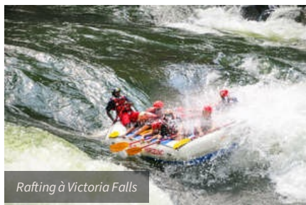
Rafting à Victoria Falls