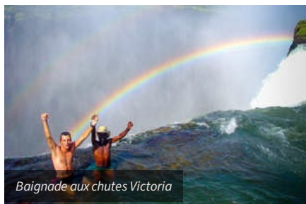
Baignade aux chutes Victoria