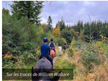
Sur les traces de William Wallace