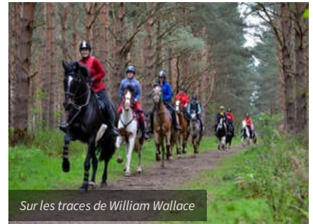
Sur les traces de William Wallace