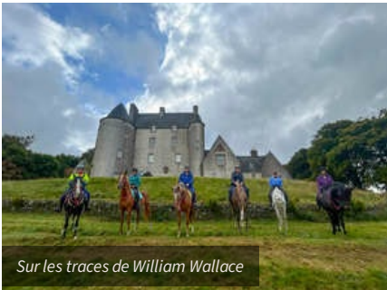
Sur les traces de William Wallace