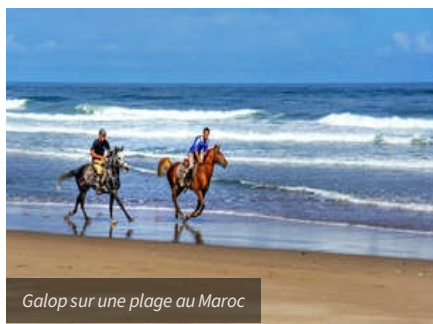
Galop sur une plage au Maroc