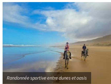
Randonnée sportive entre dunes et oasis