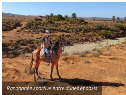
Randonnée sportive entre dunes et oasis