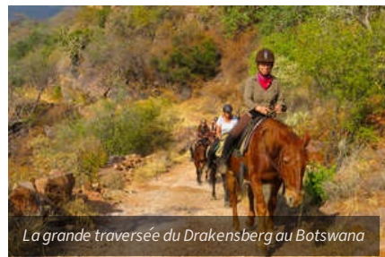
La grande traversée du Drakensberg au Botswana