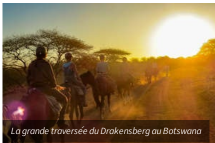
La grande traversée du Drakensberg au Botswana