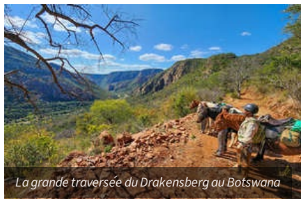
La grande traversée du Drakensberg au Botswana