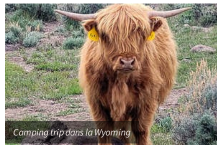
Camping trip dans la Wyoming