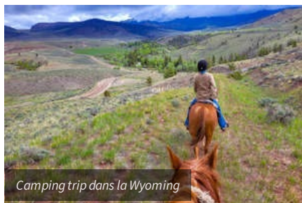
Camping trip dans la Wyoming