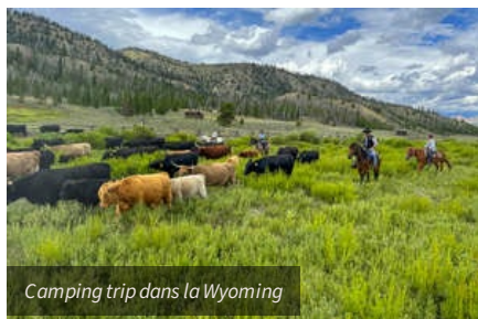
Camping trip dans la Wyoming