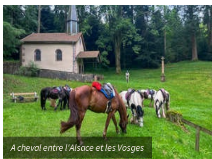
A cheval entre l'Alsace et les Vosges