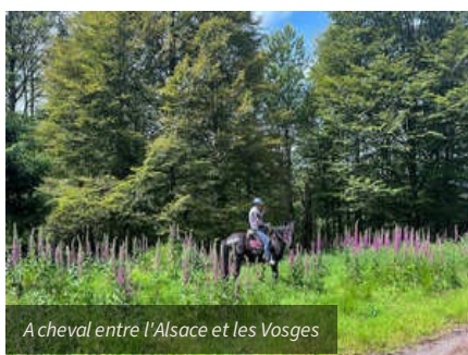
A cheval entre l'Alsace et les Vosges