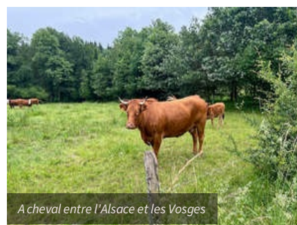
A cheval entre l'Alsace et les Vosges