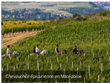
Chevauchée épicurienne en Macédoine