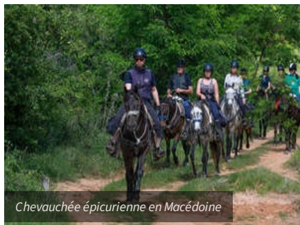
Chevauchée épicurienne en Macédoine