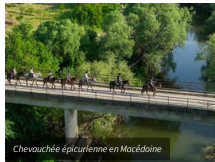
Chevauchée épicurienne en Macédoine