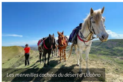
Les merveilles cachées du désert d'Udabno