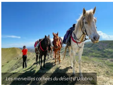
Les merveilles cachées du désert d'Udabno