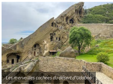
Les merveilles cachées du désert d'Udabno