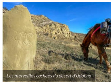
Les merveilles cachées du désert d'Udabno