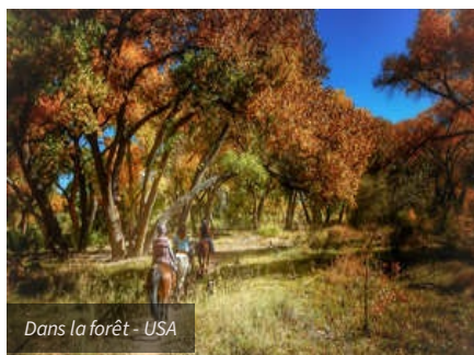
Dans la forêt - USA