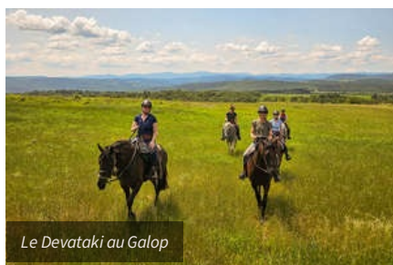
Le Devetaki au Galop