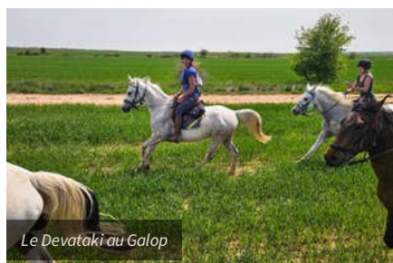
Le Devetaki au Galop