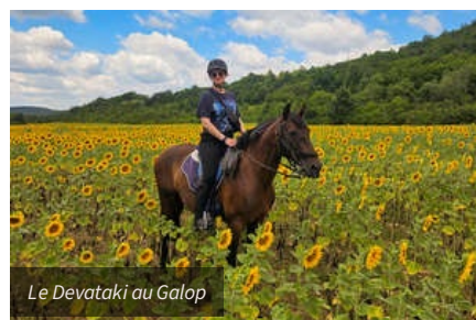
Le Devetaki au Galop