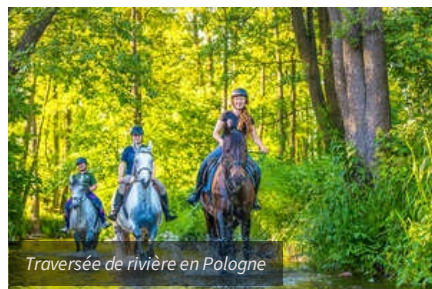
Traversée de rivière en Pologne