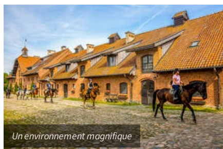
Un environnement magnifique