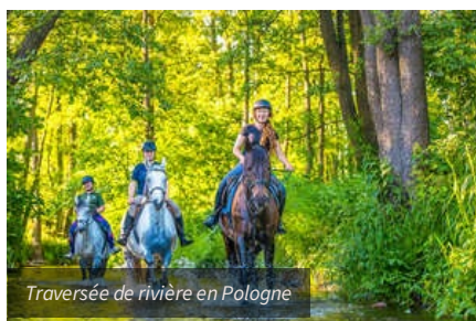
Traversée de rivière en Pologne