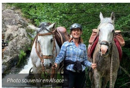
Photo souvenir en Alsace