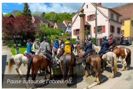
Pause autour de l'abreuvoir