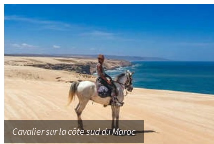
Cavalier sur la côte sud du Maroc