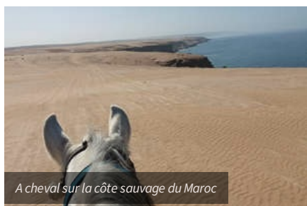
A cheval sur la côte sauvage du Maroc