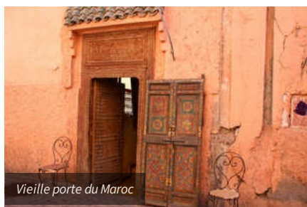
Vieille porte du Maroc