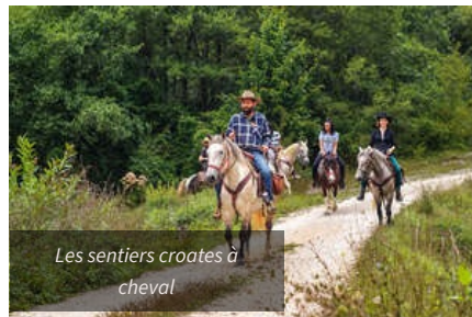
Les sentiers croates à cheval