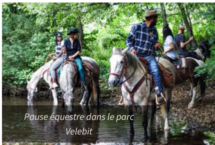
Pause équestre dans le parc Velebit