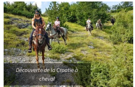
Découverte de la Croatie à cheval