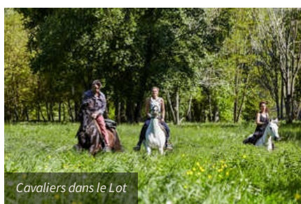
Cavaliers dans le Lot