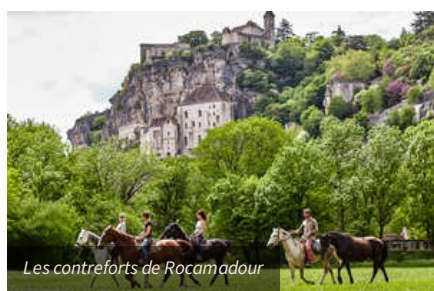
Les contreforts de Rocamadour