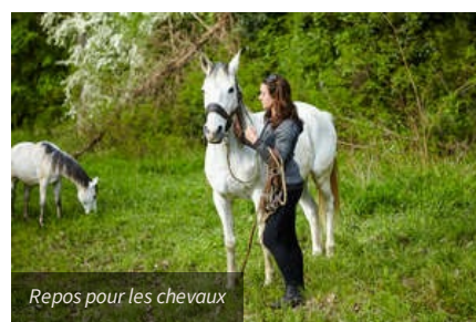
Repos pour les chevaux