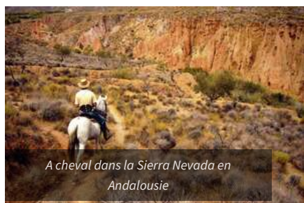
A cheval dans la Sierra Nevada en Andalousie