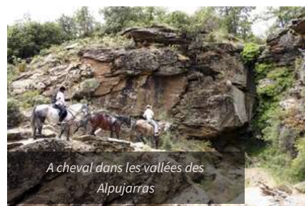
A cheval dans les vallées des Alpujarras