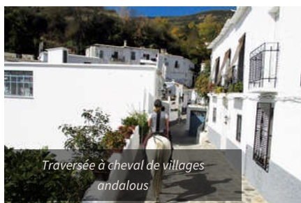
Traversée à cheval de villages andalous