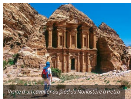
Visite d'un cavalier au pied du Monastère à Petra