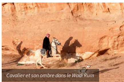
Cavalier et son ombre dans le Wadi Rum