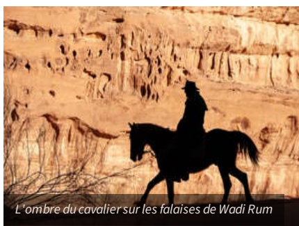
L'ombre du cavalier sur les falaises de Wadi Rum