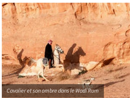
Cavalier et son ombre dans le Wadi Rum