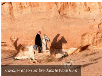
Cavalière et son ombre dans le Wadi Rum