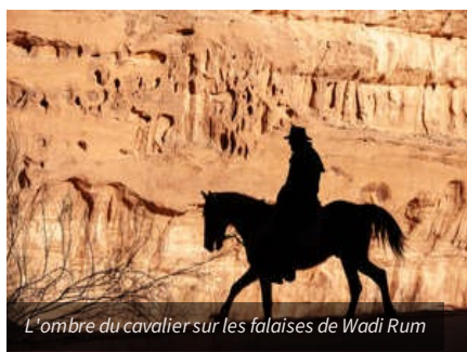
L'ombre du cavalier sur les falaises de Wadi Rum