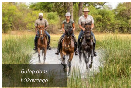
Galop dans l'Okavango