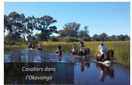
Cavaliers dans l'Okavango