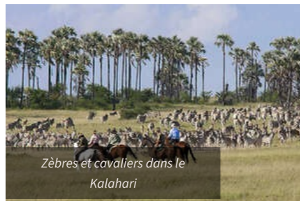
Zèbres et cavaliers dans le Kalahari