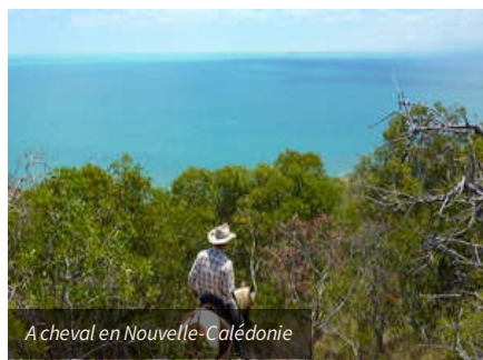
A cheval en Nouvelle-Calédonie