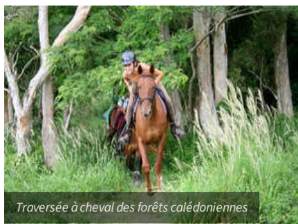
Traversée à cheval des forêts calédoniennes