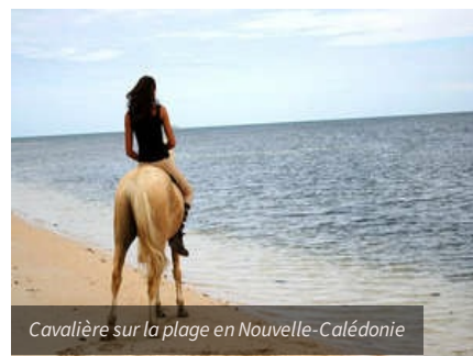
Cavalière sur la plage en Nouvelle-Calédonie