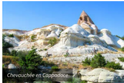
Chevauchée en Cappadoce