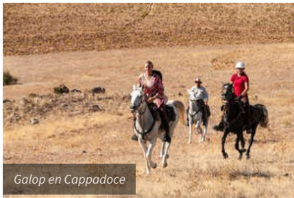
Galop en Cappadoce