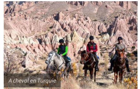
A cheval en Turquie