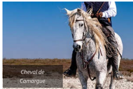
Cheval de Camargue