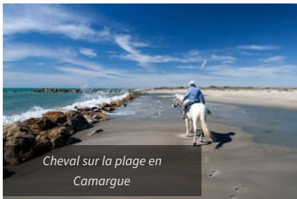
Cheval sur la plage en Camargue