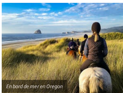
En bord de mer en Oregon