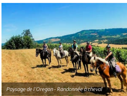
Paysage de l'Oregon - Randonnée à cheval