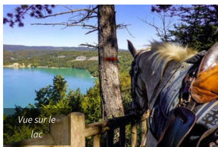
Vue sur le lac