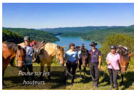
Pause sur les hauteurs