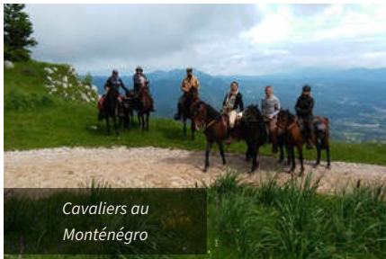
Cavaliers au Monténégro