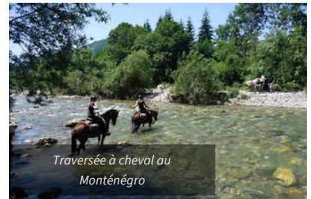
Traversée à cheval au Monténégro