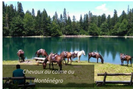
Chevaux au calme au Monténégro