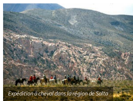
Expédition à cheval dans la région de Salta