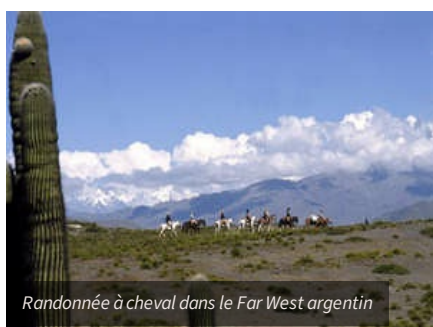
Randonnée à cheval dans le Far West argentin