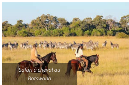
Safari à cheval au Botswana