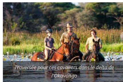
Traversée pour ces cavaliers dans le delta de l'Okavango