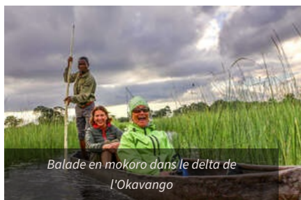
Balade en mokoro dans le delta de l'Okavango