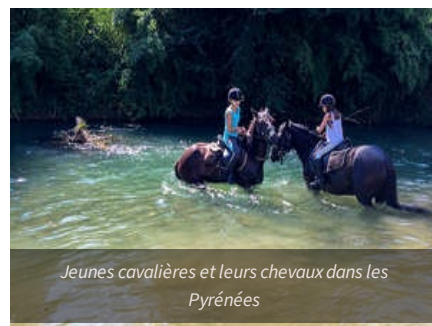
Jeunes cavalières et leurs chevaux dans les Pyrénées