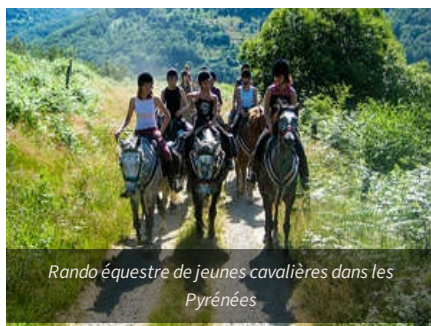
Rando équestre de jeunes cavalières dans les Pyrénées