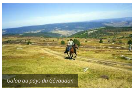
Galop au pays du Gévaudan