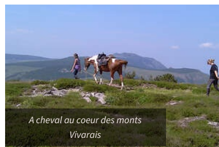
A cheval au coeur des monts Vivarais