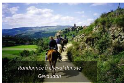
Randonnée à cheval dans le Gévaudan