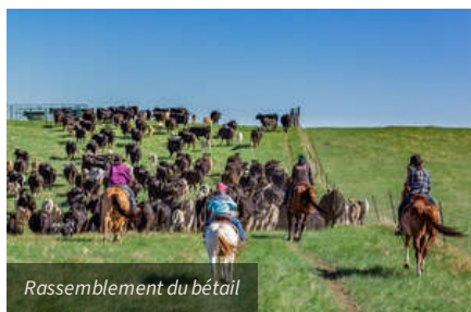
Rassemblement du bétail