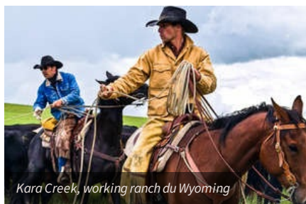
Kara Creek, working ranch du Wyoming