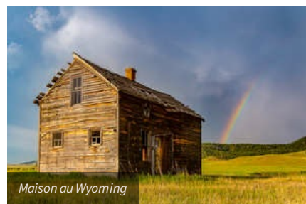
Maison au Wyoming