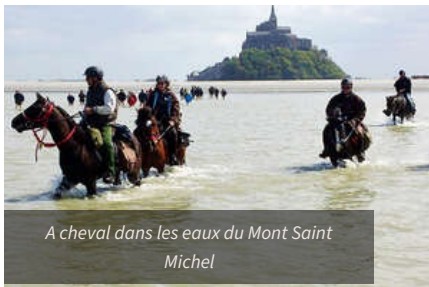
A cheval dans les eaux du Mont Saint Michel