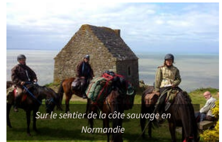
Sur le sentier de la côte sauvage en Normandie