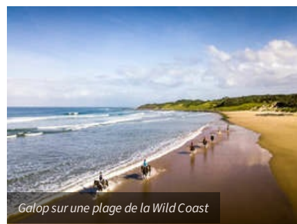
Galop sur une plage de la Wild Coast