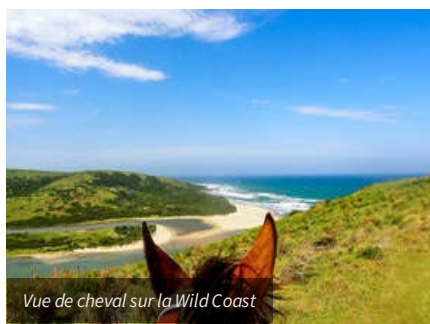
Vue de cheval sur la Wild Coast