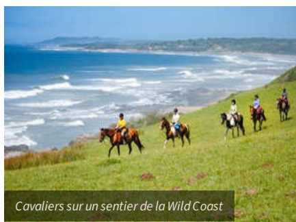
Cavaliers sur un sentier de la Wild Coast