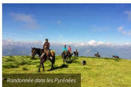
Randonnée dans les Pyrénées