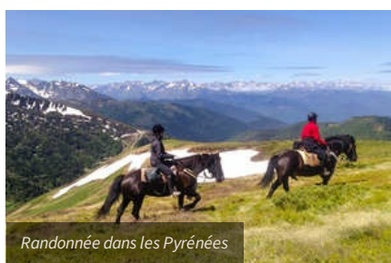
Randonnée dans les Pyrénées