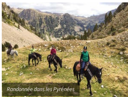
Randonnée dans les Pyrénées