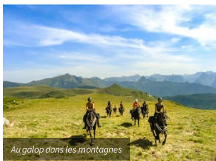
Au galop dans les montagnes