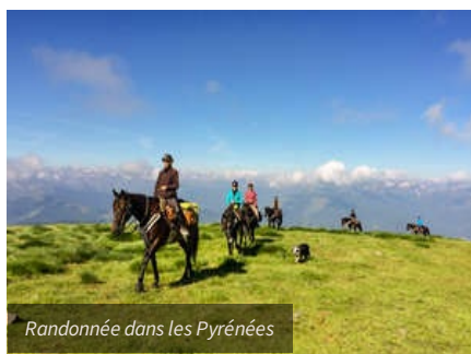
Randonnée dans les Pyrénées