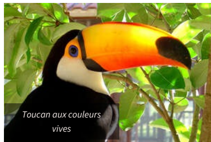
Toucan aux couleurs vives