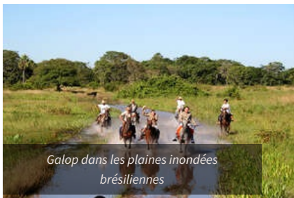
Galop dans les plaines inondées brésiliennes