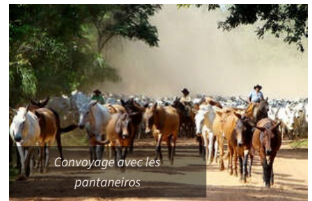
Convoyage avec les pantaneiros