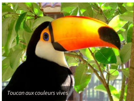
Toucan aux couleurs vives