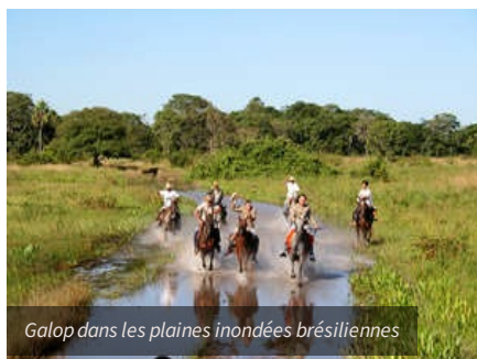
Galop dans les plaines inondées brésiliennes