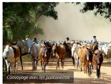
Convoyage avec les pantaneiros