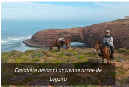
Cavalière devant l'ancienne arche de Legzira