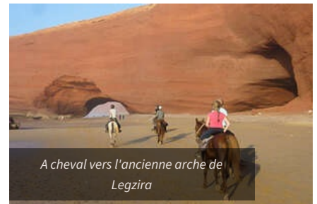
A cheval vers l'ancienne arche de Legzira