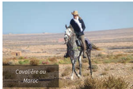
Cavalière au Maroc