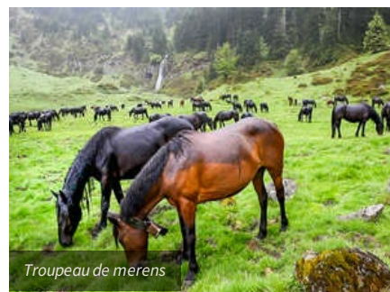
Troupeau de mérens