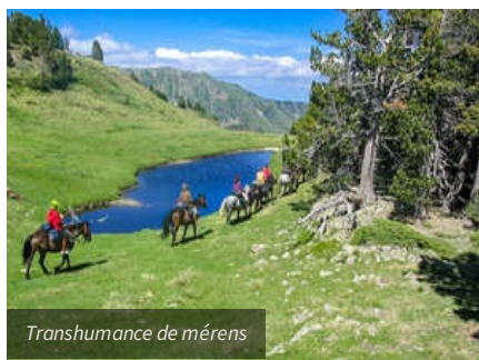
Transhumance de mérens