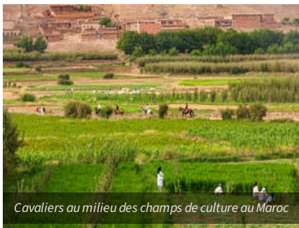
Cavaliers au milieu des champs de culture au Maroc