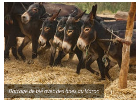
Battage de blé avec des ânes au Maroc