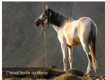
Cheval barbe au Maroc