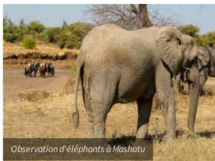
Observation d'éléphants à Mashatu