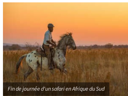
Fin de journée d'un safari en Afrique du Sud