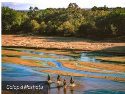
Galop à Mashatu