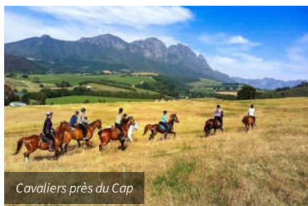
Cavaliers près du Cap