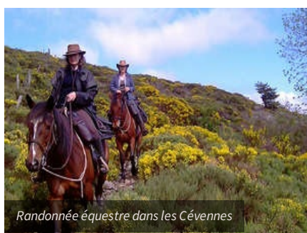
Randonnée équestre dans les Cévennes