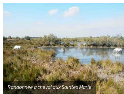
Randonnée à cheval aux Saintes Marie