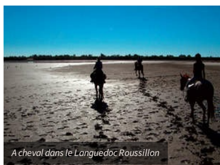
A cheval dans le Languedoc Roussillon