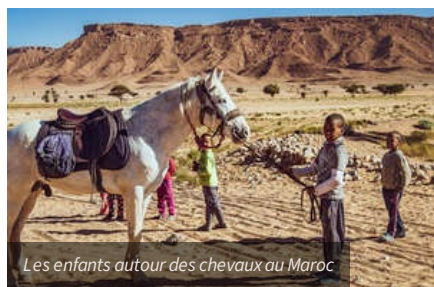
Les enfants autour des chevaux au Maroc