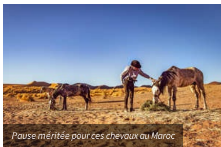
Pause méritée pour ces chevaux au Maroc