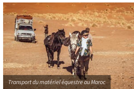
Transport du matériel équestre au Maroc